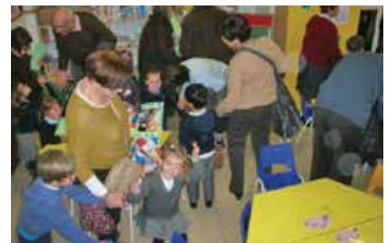
Con los abuelos en Sant Cugat. Comunicación y amor entre generaciones.