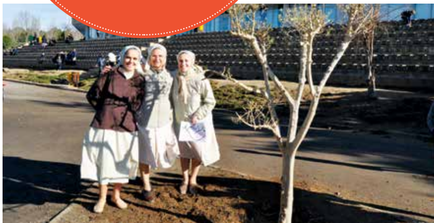
El Día de la Paz en Sant Cugat. Se plantó un olivo como símbolo de paz y un gran balón blanco rodó entre los alumnos para expresar el rechazo a la violencia.