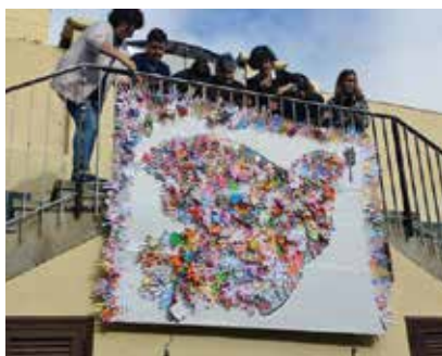
Santa Cruz. Una paloma de la paz preparada para esta jornada.