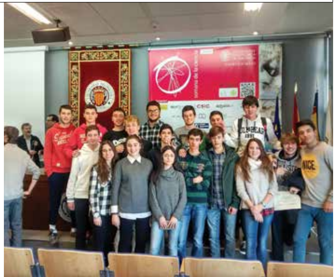
Los alumnos de Ontinyent, en el concurso.

Este concurso se enmarca dentro de las acciones para acercar a los estudiantes de secundaria y bachillerato a las enseñanzas y actividades desarrolladas por la Universidad Politécnica de Valencia, campus de Alcoy, dentro de la Semana de la Ciencia.