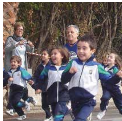
Ontinyent. Se leyó un Manifiesto por la paz y se guardó un minuto de silencio por la no violencia.