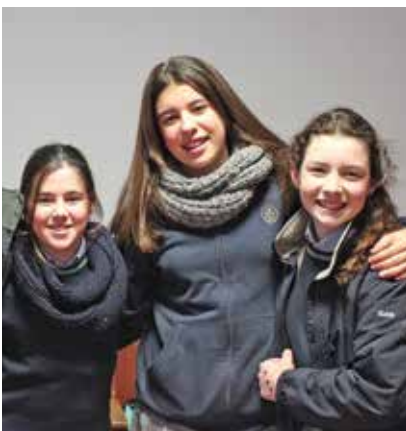
Concurso de ortografía catalana en Madre Alberta. Tercera edición del concurso, que se basa en aprendizaje cooperativo.