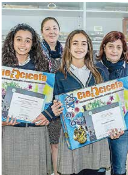
Entrega de premios en Los Realejos. Del concurso Los investigadores: su trabajo .