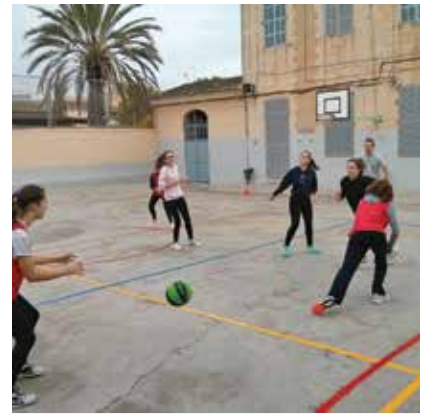
Vida saludable en Manacor. Se incentiva la dieta equilibrada y el deporte.