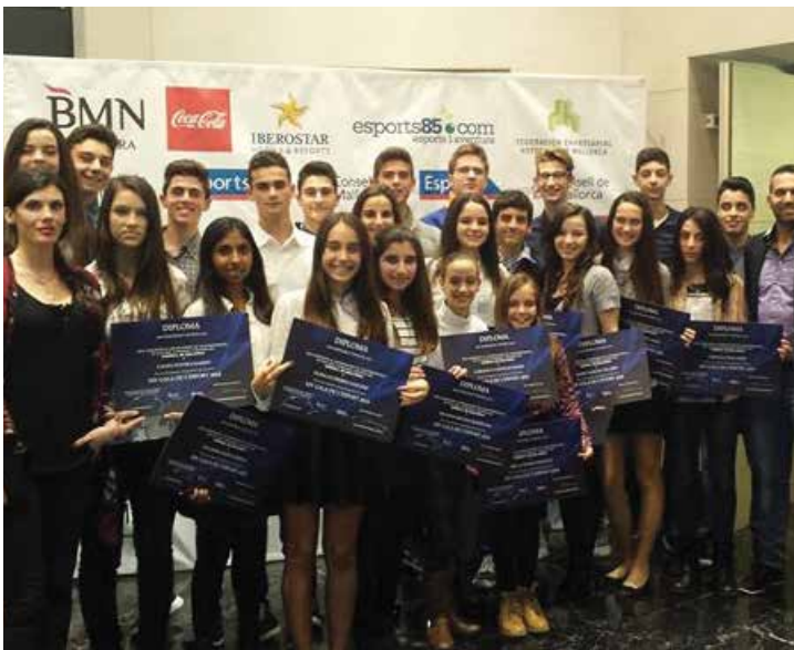
Deportistas homenajeados en la Gala de l'Esport.