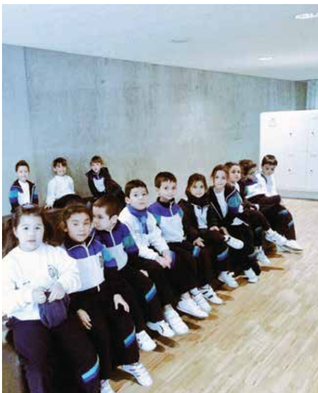
Alumnos de La Cuesta en el espacio artístico TEA.