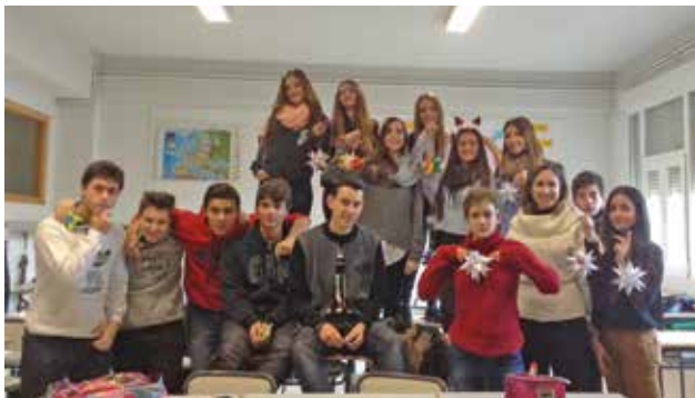
Granada trabajó de forma cooperativa e integrada la Navidad.