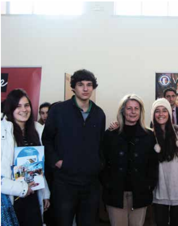
Asistentes a la feria de Madrid.

Las universidades más representativas de Madrid acudieron al Centro para informar en sus stands de diversas posibilidades de estudios universitarios. Universidades como la Pontificia Comillas, el Centro Universitario Cardenal Cisneros, la Universidad Rey Juan Carlos, la Universidad Carlos III, la Universidad Alcalá de Henares, la Universidad Politécnica de Madrid, la Universidad San Pablo-CEU, la Universidad ESIC (Business&Marketing School), la Universidad Francisco de Vitoria, la Universidad Europea de Madrid, la Universidad de Navarra, la Universidad de Nebrija, el Centro Universitario Villanueva y UTAD-Centro Universitario de Tecnología y Arte Digital se dieron cita en esta ya tradicional V Feria de Universidades en el Colegio. La Ponencia sobre mindfulness o atención plena, que se impartió de la mano de la Universidad Comillas, suscitó gran interés en los alumnos y transmitió importantes mensajes como «No puedes detener las olas, pero puedes aprender a Surfear» (J.Goldstein). Sin duda, fue una charla muy amena e instructiva.