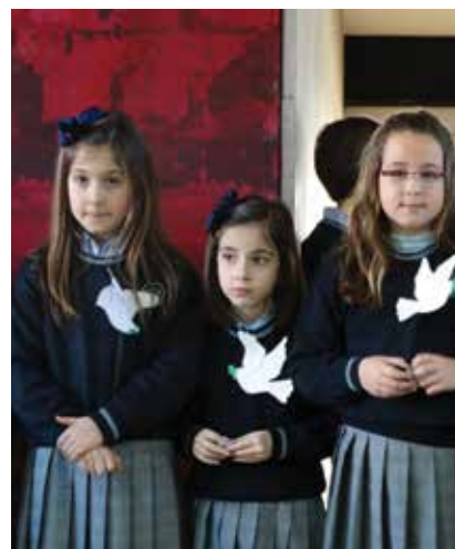
Cid. Cada alumno realizaba su súplica de paz en un 'enclave' preparado.