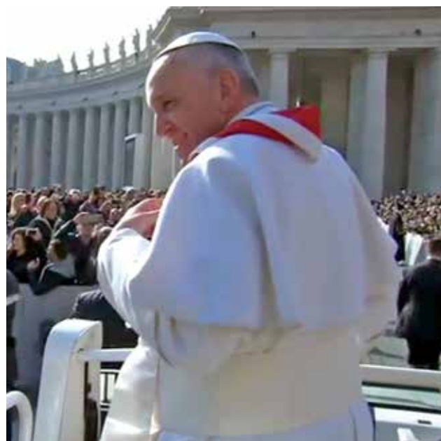
El Papa Francisco, con el pañuelo de 'Antorcha'.