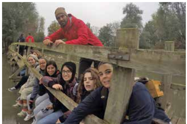
Imagen de asistentes a Taizé.

259 jóvenes de diferentes colegios de la Pureza en España disfrutaron el pasado mes de noviembre de la profunda experiencia que supone compartir unos días en la comunidad ecuménica de Taizé, en Francia. Una experiencia que por muchos motivos, queda grabada en los corazones de los asistentes. Para algunos era la primera vez, para otros la tercera o la cuarta. Para todos, unos días de parada, de reflexión, de convivencia, de oración y de compartir.