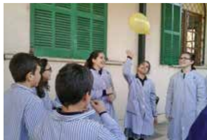
En Religión de Primaria de Inca se trabajaron los beneficios de compartir.

En clase de Religión de 6º de Primaria de Pureza de María Inca, en consonancia con el objetivo de curso de Tu felicidad es mi felicidad , trabajaron el concepto de ser agradecidos, y de cómo siéndolo se pueden compartir más cosas y asemejarse a Jesús, que se entregó por todos.