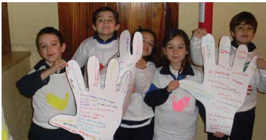
Granada. En Granada se unieron las manos por la paz y se profundizó sobre su valor, teniendo en cuenta el mensaje del Papa Francisco.