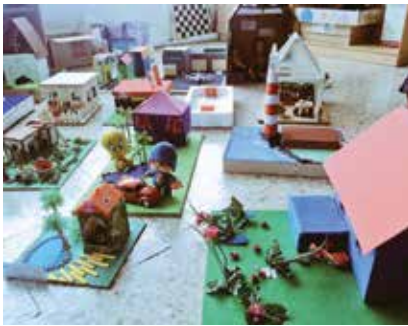
Circuitos eléctricos. Proyecto de 6º de Primaria en Pureza La Cuesta.