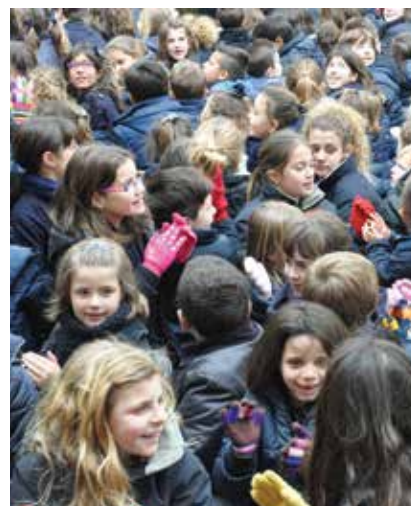
Inca. Todo el colegio se unió para hacer un gesto en favor de la paz.