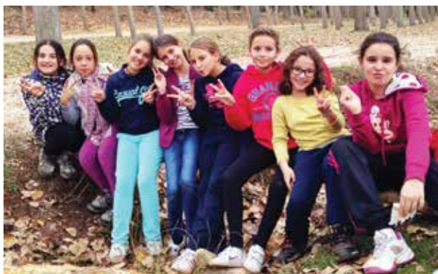
Varias imágenes de la excursión a Huétor de Santillán.