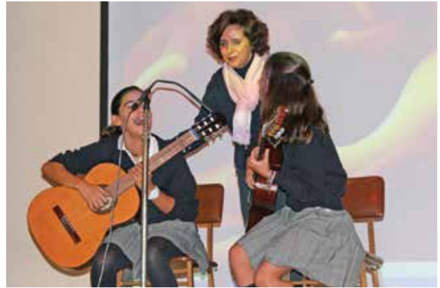
Una imagen del Concurso de Talentos de Madrid.

Además, con el Concurso de Talentos se da el toque de inicio en el colegio de la capital de España a las Fiestas Navideñas. Los alumnos de Madrid tienen un don y cada año sorprenden siendo más y mejores. ¡Enhorabuena!