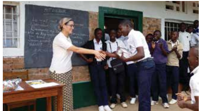
Imágenes de la entrega de premios del concurso.