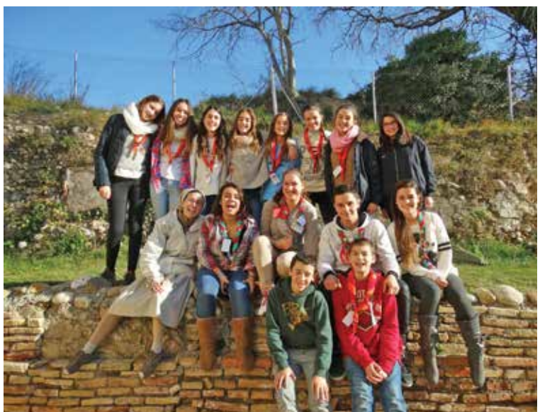
Instante de la convivencia de los 4 grupos de FOC.

En otro orden de cosas, los miembros de FOC de Cid y Grao se volvieron a reunir y aprovecharon la onomástica de San Vicente, el pasado 22 de enero, para viajar a Javalambre y disfrutar de un rato en la nieve.