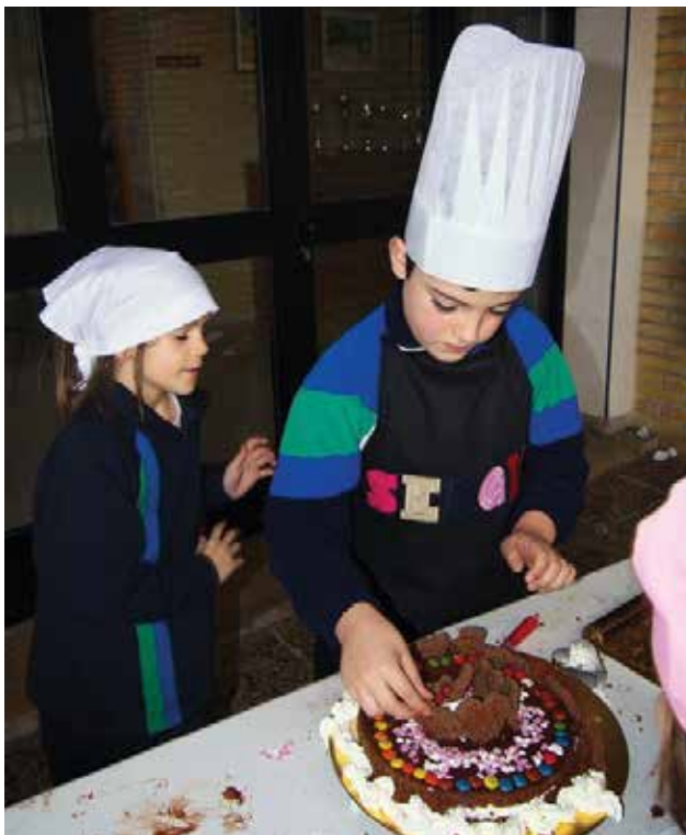
En 'Purechef', los alumnos de Primaria de Pureza de María Cid se organizaron en grupos de 3 ó 4 alumnos con el objetivo de preparar una receta.

En el proceso, los estudiantes descubrieron y confirmaron que son unos artistas, y la muestra de que todo resultó perfecto es que no sobro nada de nada: se lo comieron todo. Es también de agradecer a los tutores su imaginación y ganas y también la implicación de las familias del colegio con los preparativos.