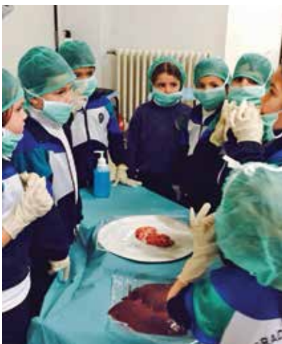
Jóvenes médicos en Granada. De esta forma tan divertida se sumergen en los secretos de la cirugía en Infantil.