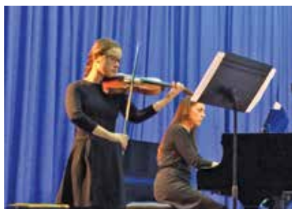
Uno de los alumnos galardonados.