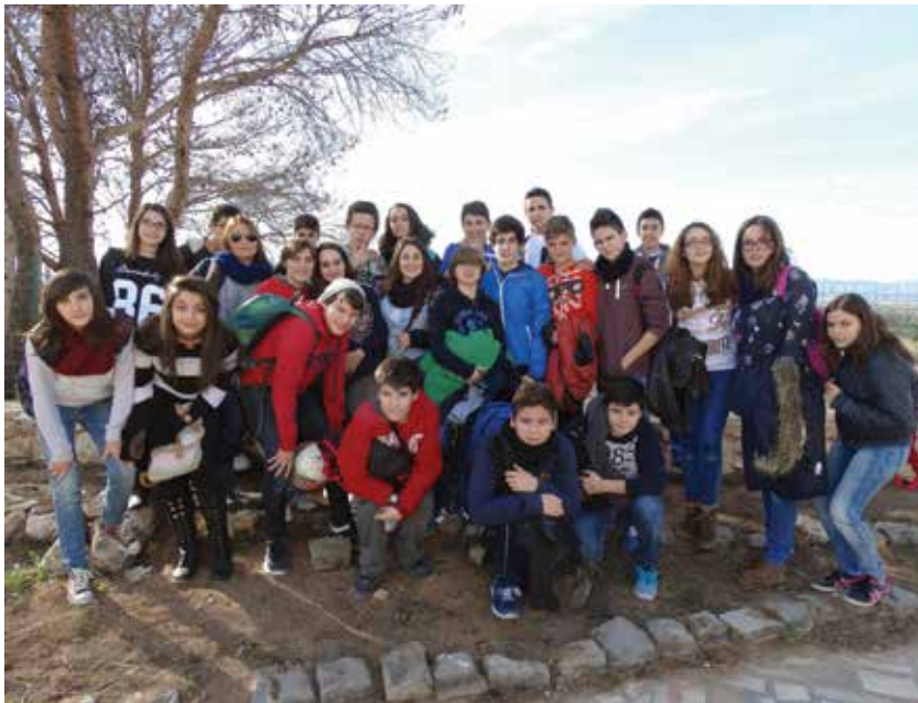
Reforestación en Calicanto. Los alumnos de 2º de ESO de Cid participaron en la reforestación de la zona cercana a la casa de convivencias, afectada por un incendio.