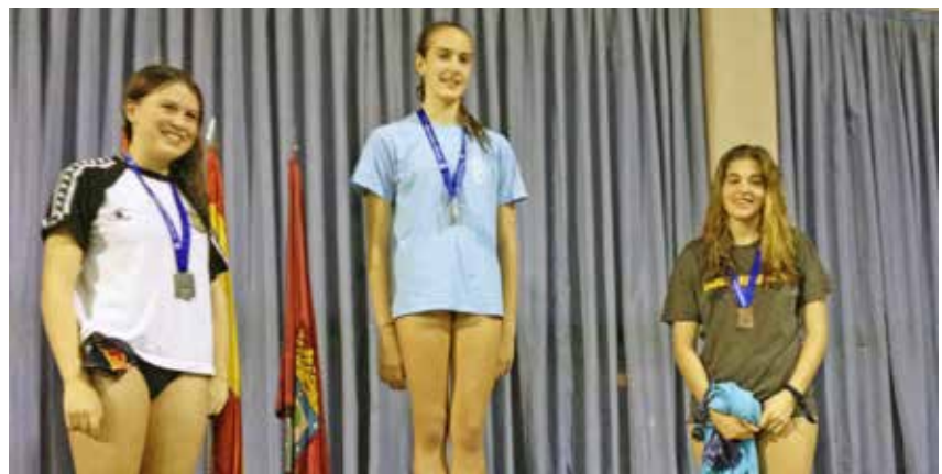
Medallistas en los Juegos Deportivos de Madrid. El 14 de febrero de 2015 se celebró una prueba de los Juegos Deportivos Municipales, obteniendo dos medallas de bronce: 50 metros espalda y el equipo de relevos de crol cadete femenino.