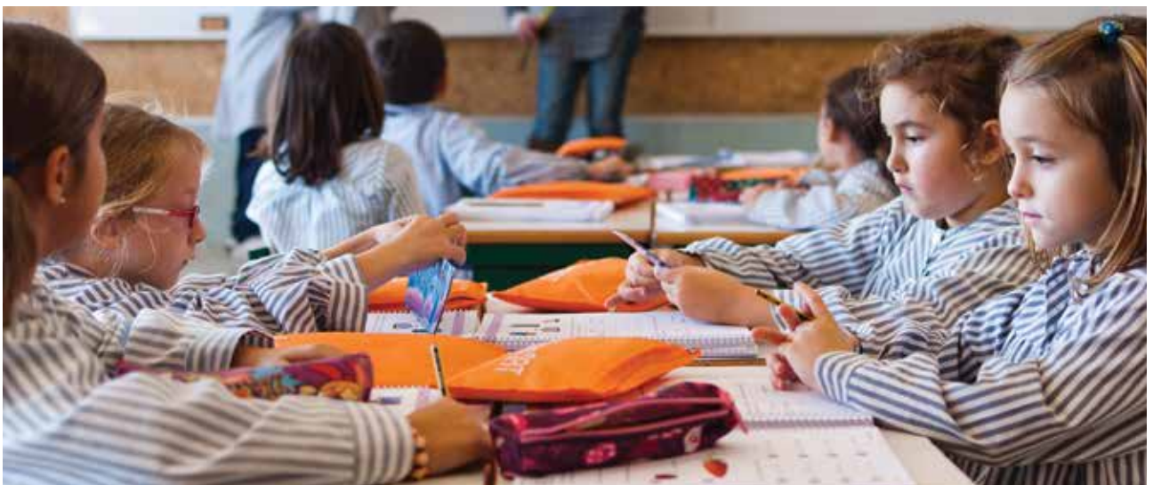
Los colegios de Pureza de María realizan una apuesta por la innovación en todas sus facetas.