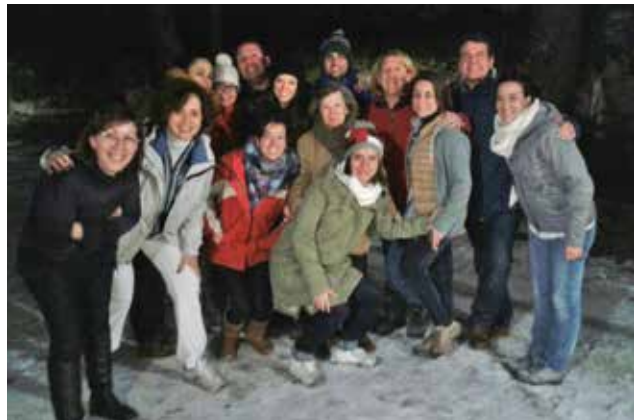
Profesores participantes en el retiro.

El pasado 16 y 17 de enero algunos de los profesores del Colegio Pureza de María de Madrid tuvieron la oportunidad de reencontrarse en un Retiro espiritual. Las Hermanas acogieron a los docentes en su casa de Cercedilla, municipio situado en la Sierra de Guadarrama, en el noroeste de Madrid, donde gozaron del silencio y de la nieve. Unas palabras de un versículo del profeta Isaías resumen lo vivido: « Eres precioso a mis ojos, eres estimado y yo te amo » (Is 43,7).