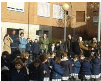
Madrid. Se recordó para la paz «hace falta más valor que para la guerra».