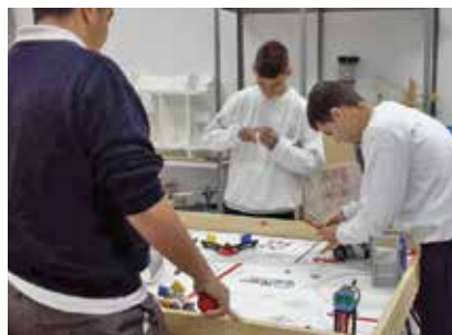
Imagen del equipo de La Cuesta participante en el concurso de robótica.